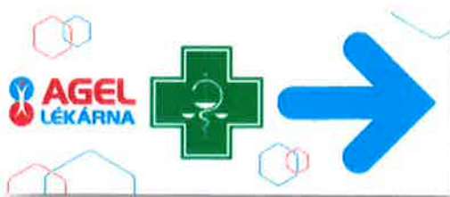
a) Varianta s logem Lékárna AGEL